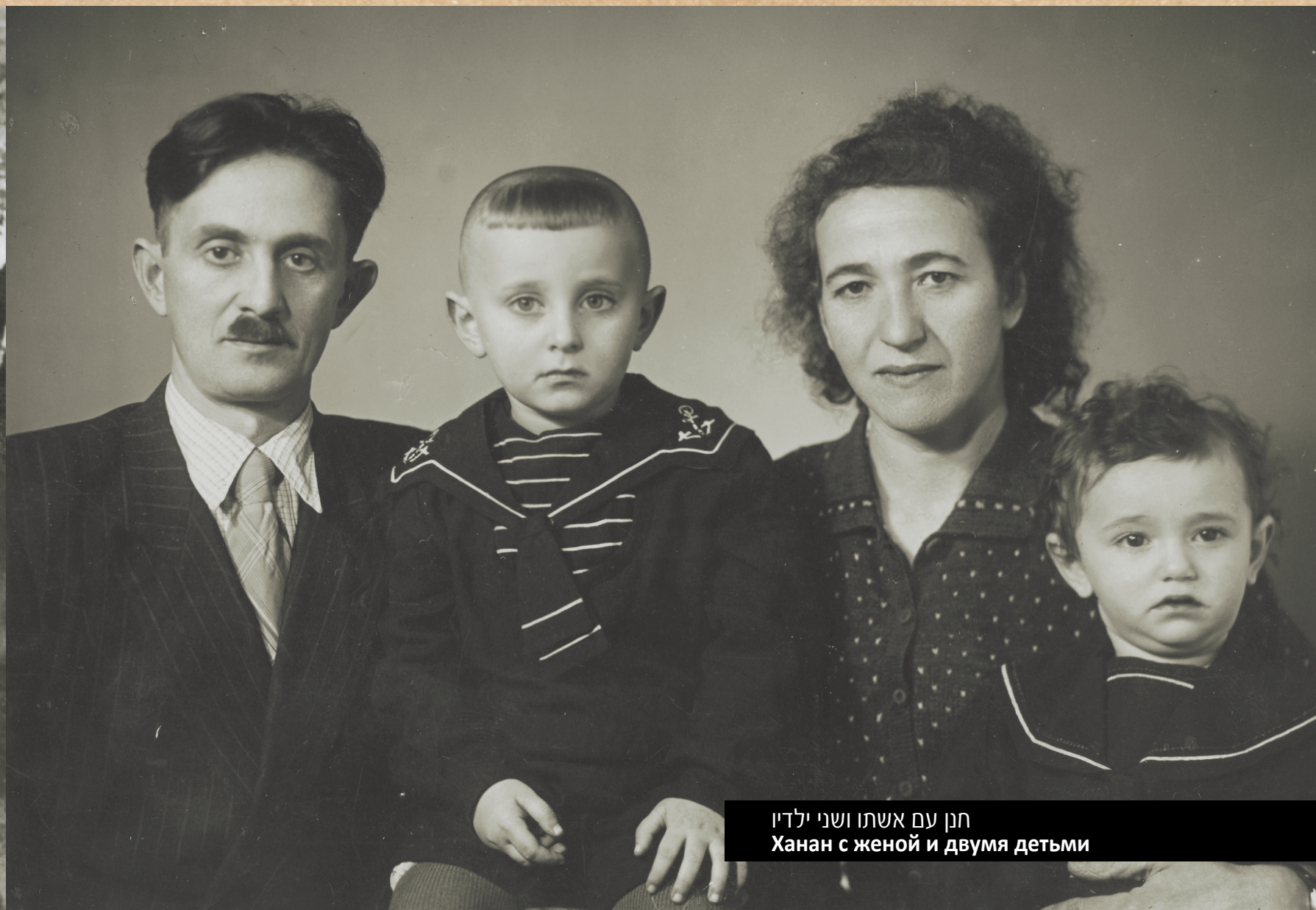
חנו עם אשתו ושני ילדיו Ханан с женой и двумя детьми