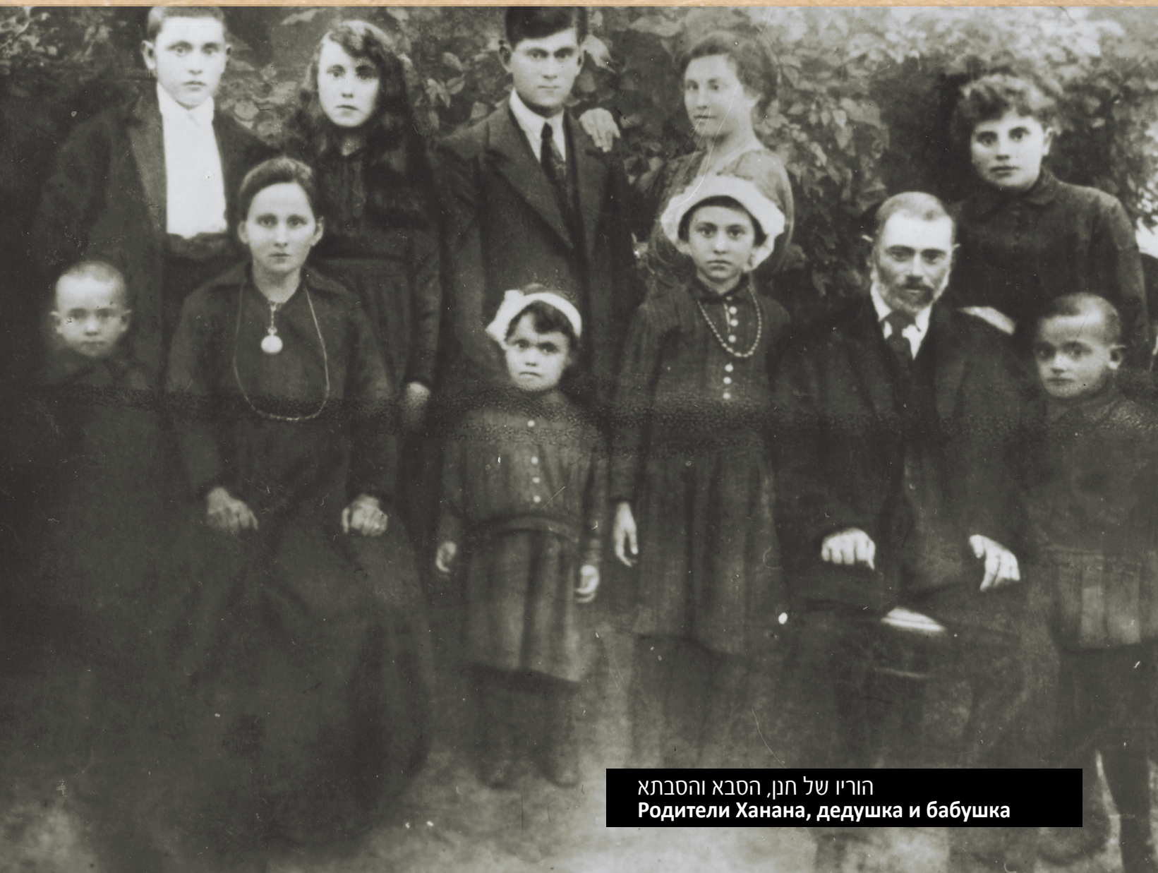
הוריו של חנו, הסבא והסבתא Родители Ханана, дедушка и бабушка